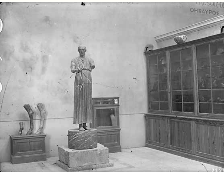
ΕΙΚ.8. Ο Ἡνίοχος στο παλαιὸ Μουσεῖο Δελφῶν.

(εξάρτημα του Ἡνίοχου). 13 Με ακόμη πιο έκδηλη αγωνία περιγράφει την κατάσταση της οροφής στην αίθουσα των χαλκών η οποία ήταν έτοιμη να καταρρεύσει ακριβώς εἰς τὸ μέρος ἔνθα ἔχει τοποθετηθεῖ ὁ Ἡνίοχος. (ΕΙΚ. 8) 14 .